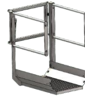
Palier de sortie frontale